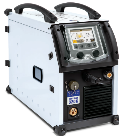
Livré sans accessoires

*Kit connectique numérique nécessaire (réf. 063938)